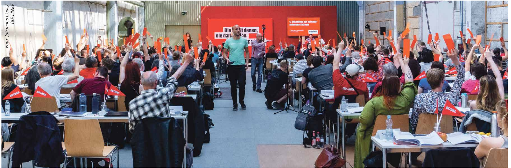
„Die Zukunft der Stadt solidarisch entwickeln“ war das Motto des 9. Landesparteitages Berlin im Mai.