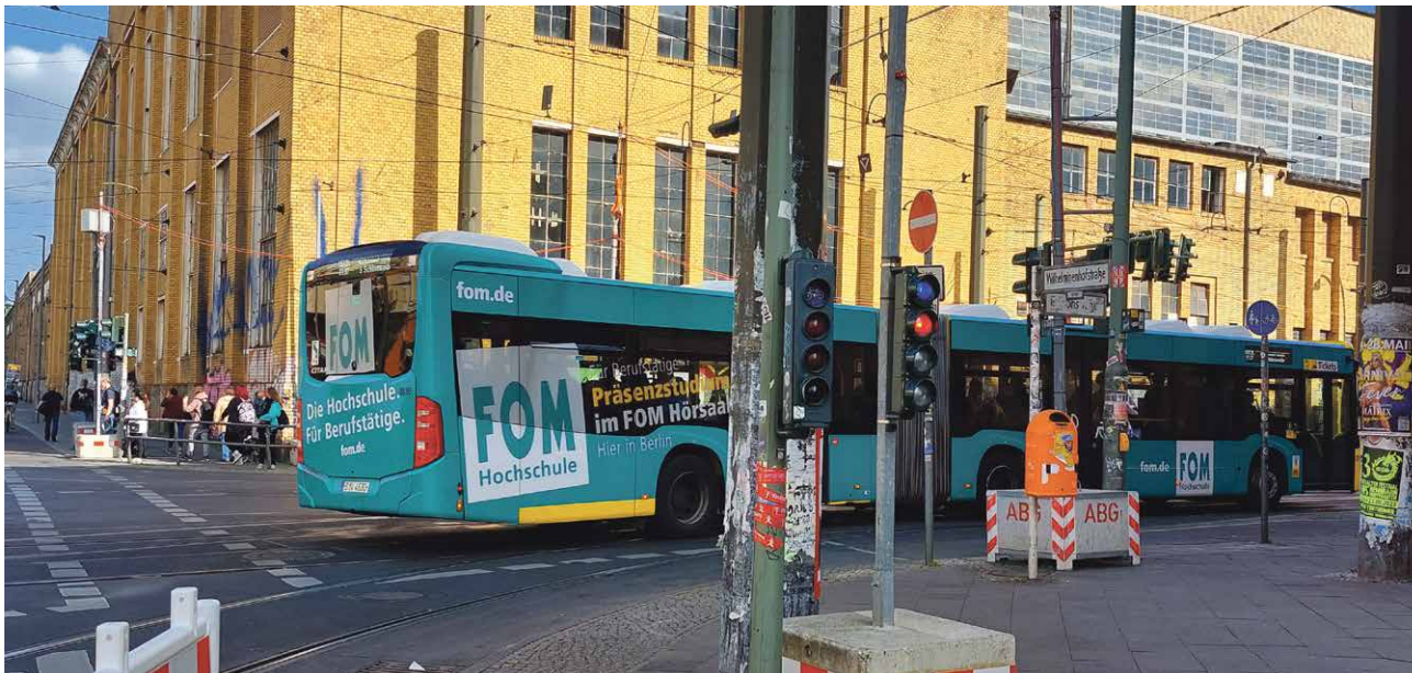
In Oberschöneweide droht eine Verschlimmerung der Verkehrssituation.