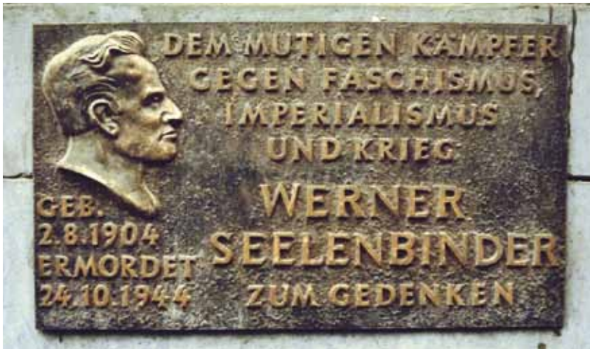
Das Foto zeigt die im Jahre 2003 verschwundene Tafel.

Um die Kosten für unsere Bezirkszeitung decken zu können, ist eine Spende von mindestens 25 Cent für jede Ausgabe notwendig. Allen Spendern herzlichen Dank für die Unterstützung. Überweisen Sie Ihre Spende bitte an: DIE LINKE Berlin IBAN: DE59100708480525607803 BIC: DEUTDEDB110, Berliner Bank AG Verwendungszweck: 502-810, sowie Name, Vorname und Anschrift angeben