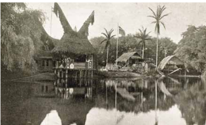
Die Inszenierung des „Fremden“. Das von acht Tolai bewohnte „Südseedorf“ Tarawai am Karpfenteich im Treptower Park.